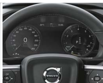
Combiné d'instrument digital 12.3"