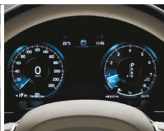
Combiné d'instruments digital