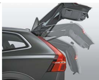
Hayon de coffre électrique