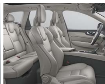
Assise et dossier des sièges en Cuir