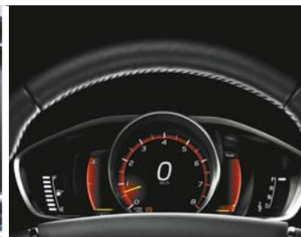
Combiné d'instruments digital