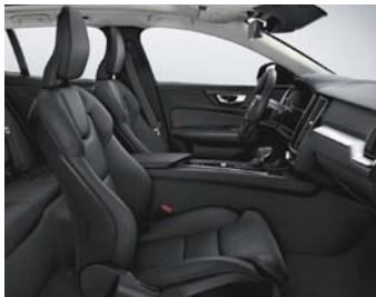
Sellerie Cuir avec Sièges confort

Modèle présenté : Finition Business avec options