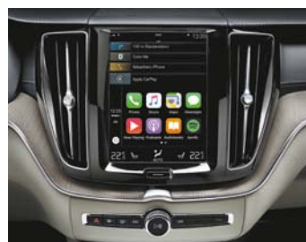
Sensus Connect et Sensus Navigation

Modèle présenté : Finition Inscription avec options