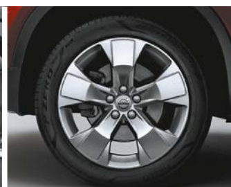
Jantes alliage 18"