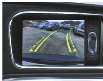
Caméra de recul

Modèle présenté : Finition Business avec options